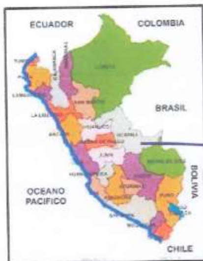
MAPA DEL PERÚ