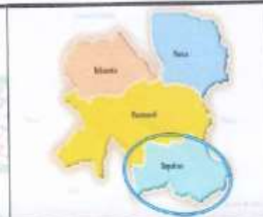
DISTRITO DE SEPAHUA