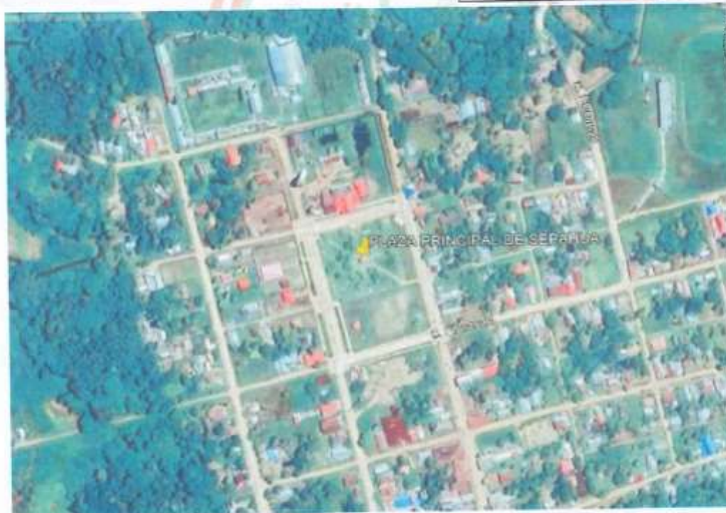
PLAZA MAYOR - VILLA SEPAHUA

Email: alcaldia@munisepahua.gob.pe / mesadepartes@munisepahua.gob.pe