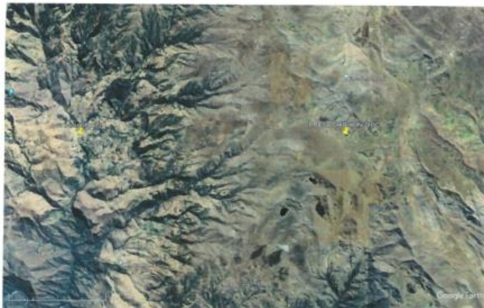
Imagen: Ubicación de la Obra.

"Año del Bicentenario, de la consolidación de nuestra independencia, y de la conmemoración de las heroicas Batallas de Junín y Ayacucho"