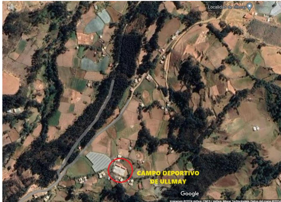
VISTA SATELITAL, FUENTE: GOOGLE EARTH