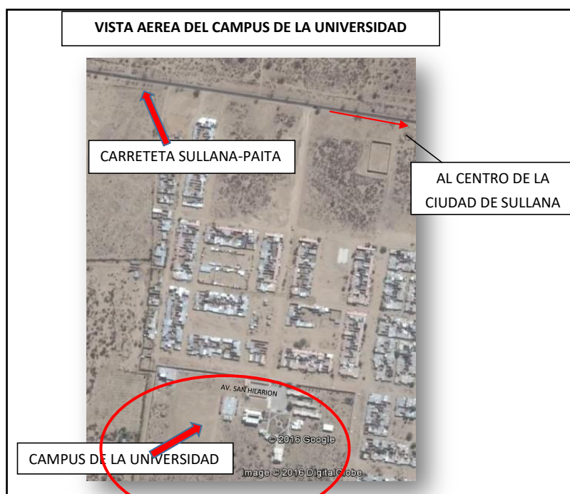
Grafico N° 3: UBICACIÓN DEL PROYECTO

La Universidad de Frontera Sullana (UNF), se ubica en la Provincia de Sullana, en el Distrito de Sullana, específicamente en el AH. Villa Perú - Canadá, que se ubica en una zona de expansión urbana de la ciudad.