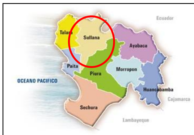
Grafico N° 2

La Universidad de Frontera Sullana (UNF), se ubica en la Provincia de Sullana, en el Distrito de Sullana, específicamente en el AH. Villa Perú - Canadá, que se ubica en una zona de expansión urbana de la ciudad.