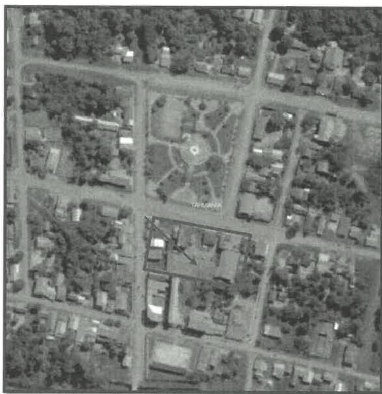
MAGEN N° 02. LOCALIZACIÓN DEL PROYECTO