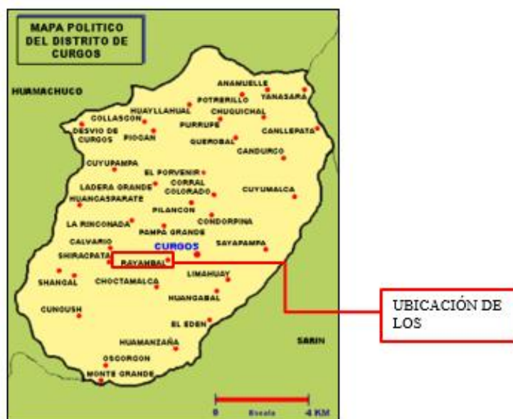
Ilustración 2: Micro - Localización.