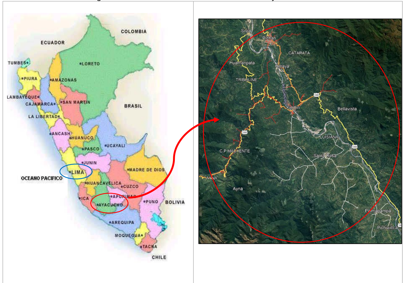
Figura N° 1: Localización del área de influencia del Proyecto