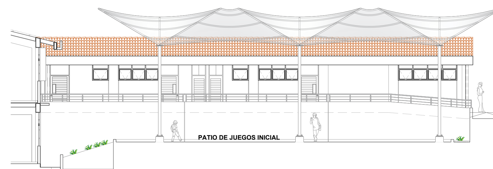
COBERTURA TENSADA PATIO DE JUEGOS DE INICIAL - CORTE 2 ESCALA 1/125