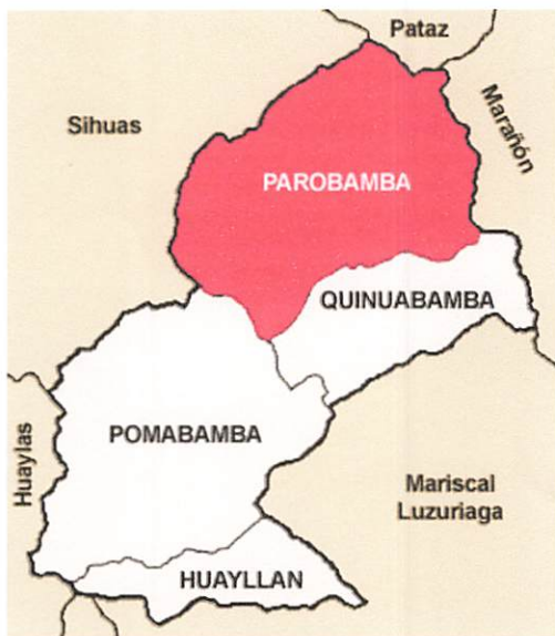
Distrito de parobamba