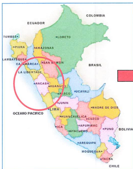
Mapa del Perú – Ancash