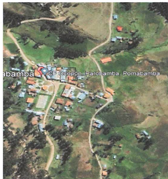
Centro Poblado de Ocopon