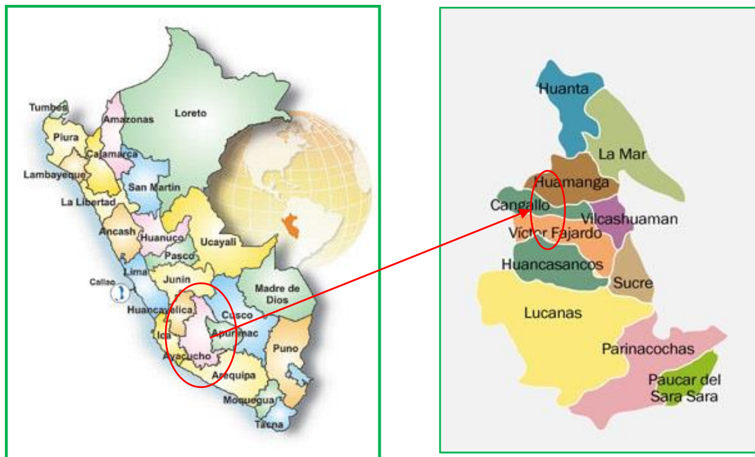
IMAGEN 01: Ubicación departamental, provincial y distrital del proyecto.