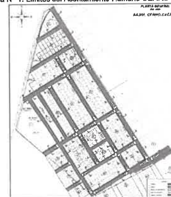
Figura N° 1: Límites del Asentamiento Humano CERRO CACHITO.