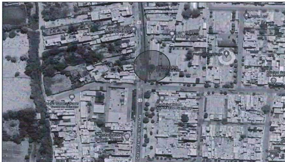
Ubicación de la institución educativa nivel primaria N°22355 Maria Darquea de Cabrera – distrito de Santiago, provincia de Ica, departamento de Ica.

La institución educativa nivel primario Maria Darquea de Cabrera N°22355, se encuentra ubicado en el distrito de Santiago, provincia de Ica, departamento de Ica, cuyo terreno se encuentra inscrito en los registros públicos a favor del Ministerio de Educación en la partida N°P07031534, con un área de 5,420.200 m 2 y un perímetro de 295.17 Ml.