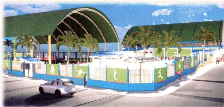
Imagen N°02: Vista Isométrico 3D (Iluminación de Noche)