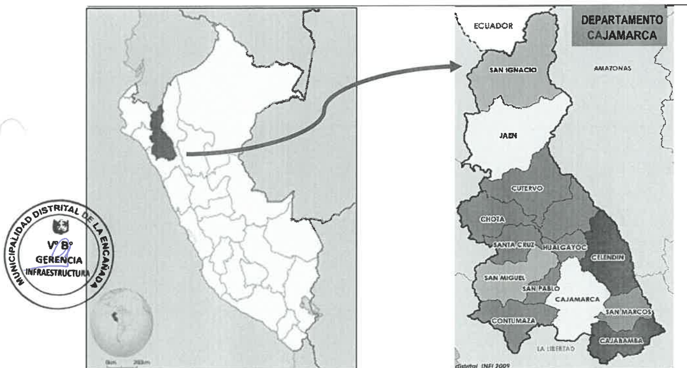
Figura 01. Ubicación del proyecto Fuente: Elaboración propia – 2024