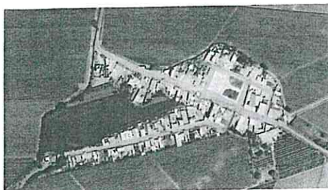
Imagen N°01: Ubicación del Proyecto

Provincia : Cañete Distrito : San Vicente Ubicación : Centro Poblado Pampa Castilla