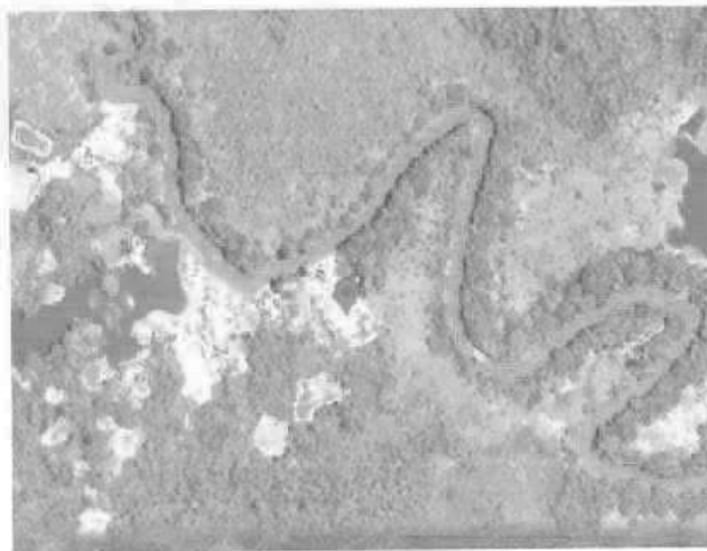
Figura 02: ubicación de la comunidad Nueva Alegria