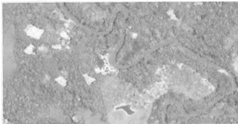
Figura 02: ubicación de la comunidad Puerto Chuinda