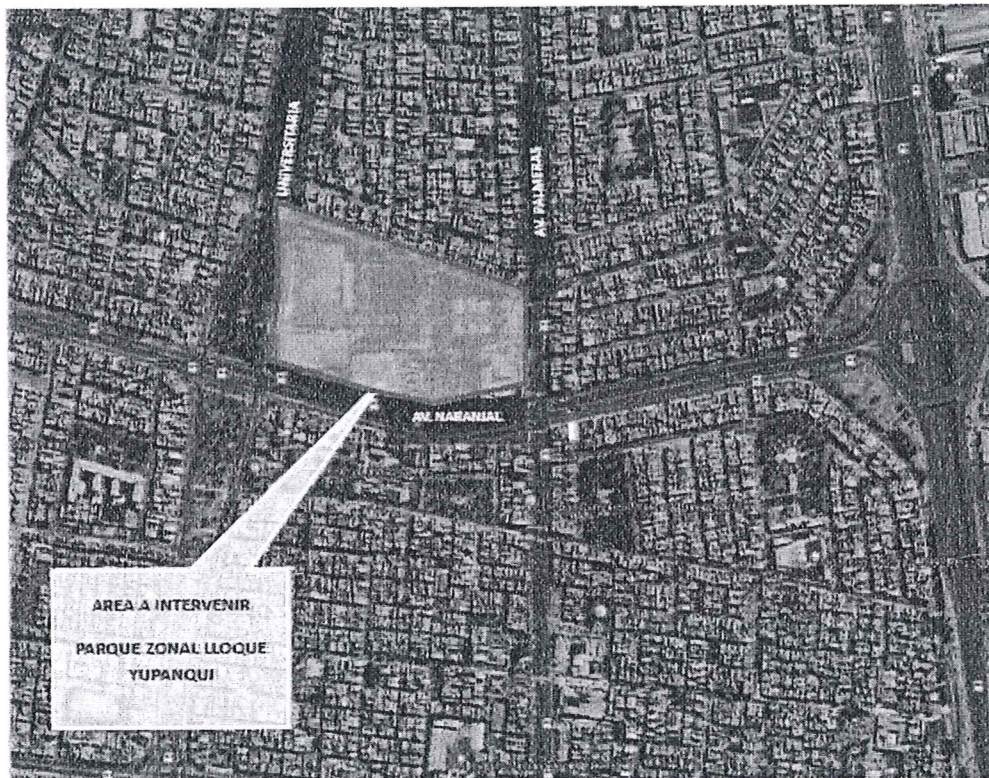
VISTA AEREA DEL PARQUE ZONAL LLOQUE YUPANQUI