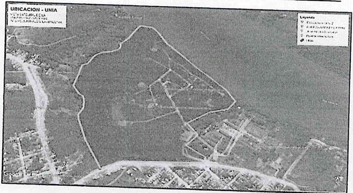
Fig. Vista satelital de la UNIA.