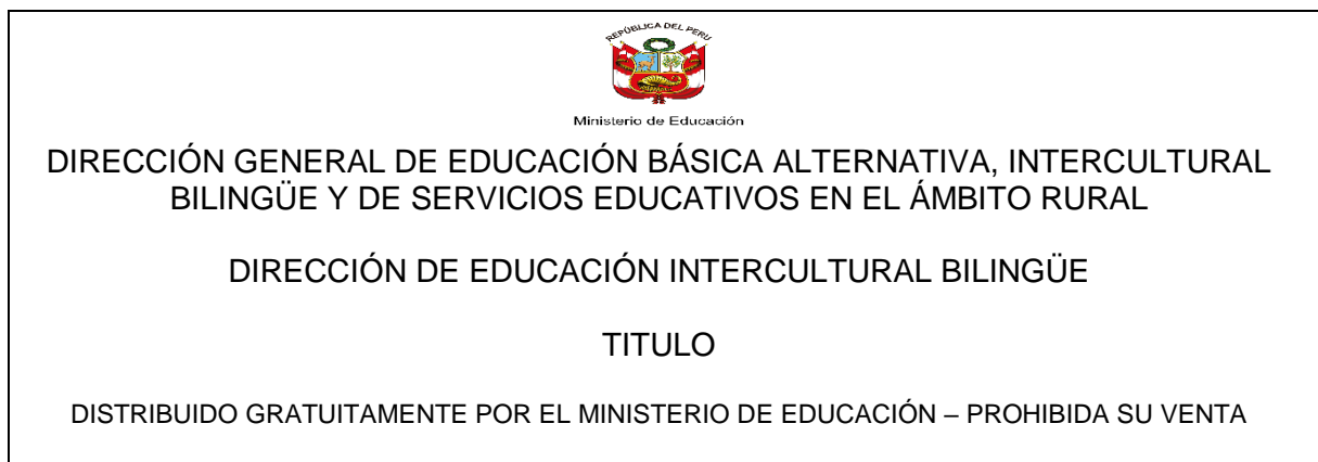
FIGURA N° 03