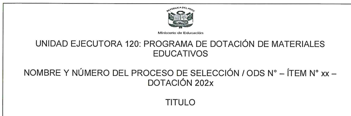
FIGURA N° 04