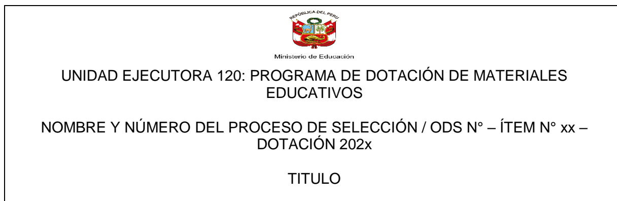
FIGURA N° 04