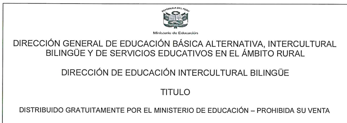
FIGURA N° 03