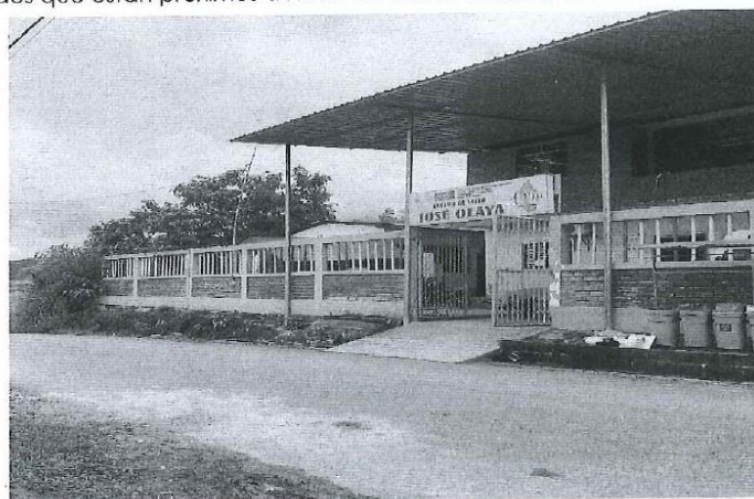
Ilustración: Situación actual del estado que se encuentran el Centro de Salud de José Olaya.