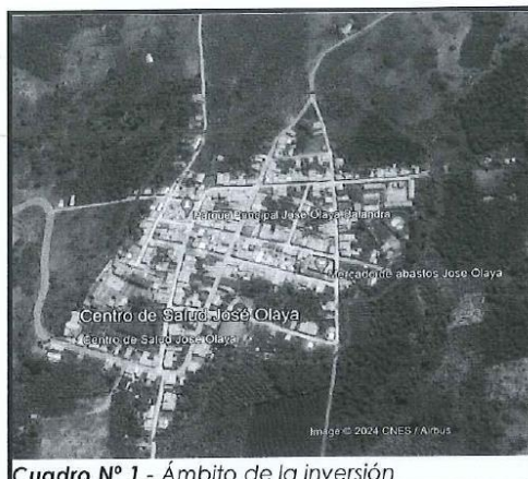
Cuadro N° 1 - Ámbito de la inversión