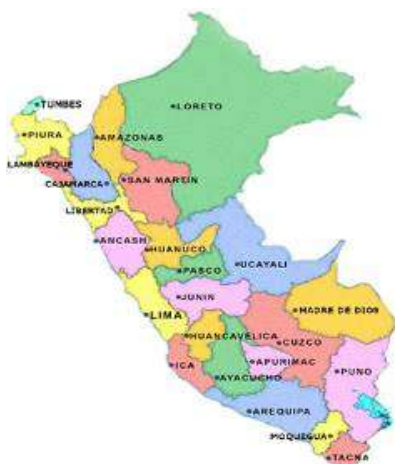
Mapa del Perú