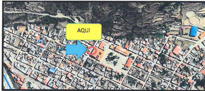
IMAGEN N° 01 Lugar donde se entregara el bien.

Los bienes serán entregados en el almacén de jr. Arequipa al costado del coliseo municipal de Chalhuanca previamente se coordinará con el residente de obra.