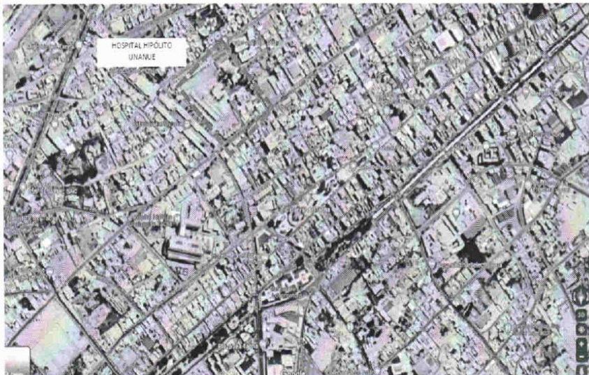
IMAGEN N° 2: CROQUIS DE LOCALIZACIÓN

Año del Bicentenario, de la consolidación de nuestra Independencia, y de la conmemoración de las heroicas batallas de Junín y Ayacucho"