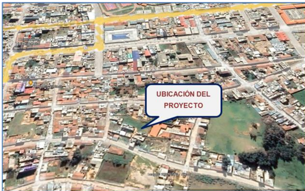
FIGURA 04: IMAGEN 04. UBICACIÓN GEOGRÁFICA DEL LUGAR DEL PROYECTO