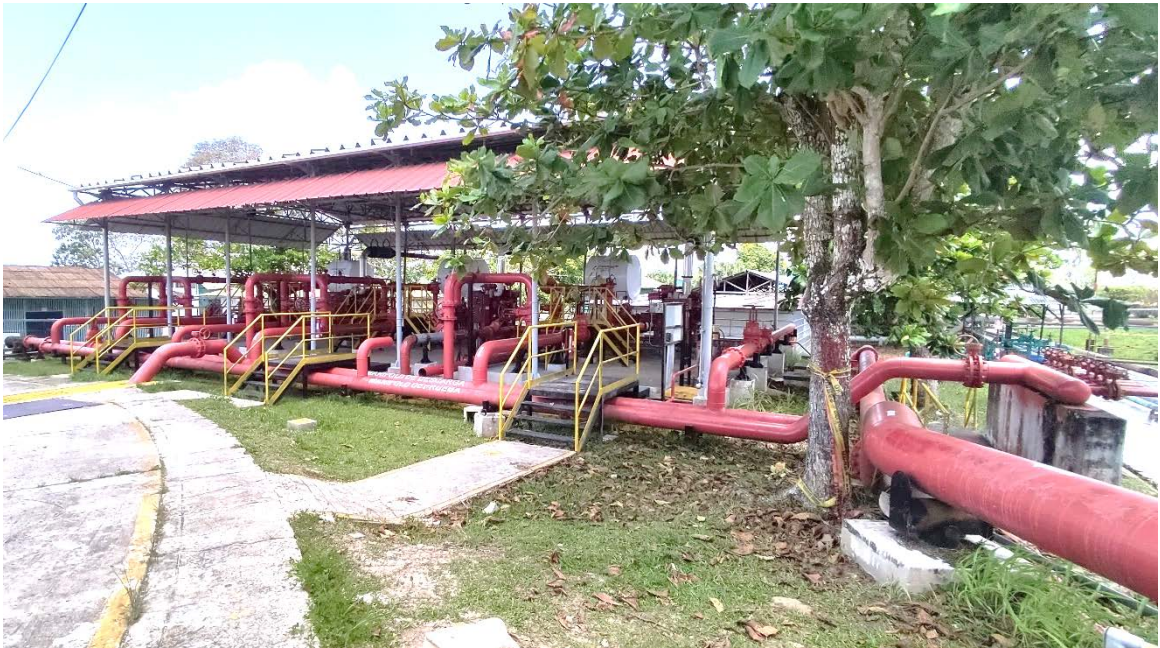
Caseta de Bombas Contraincendios Refinería Iquitos.