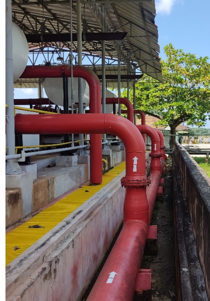
Motobomba Contraincendios y Línea de Succión.