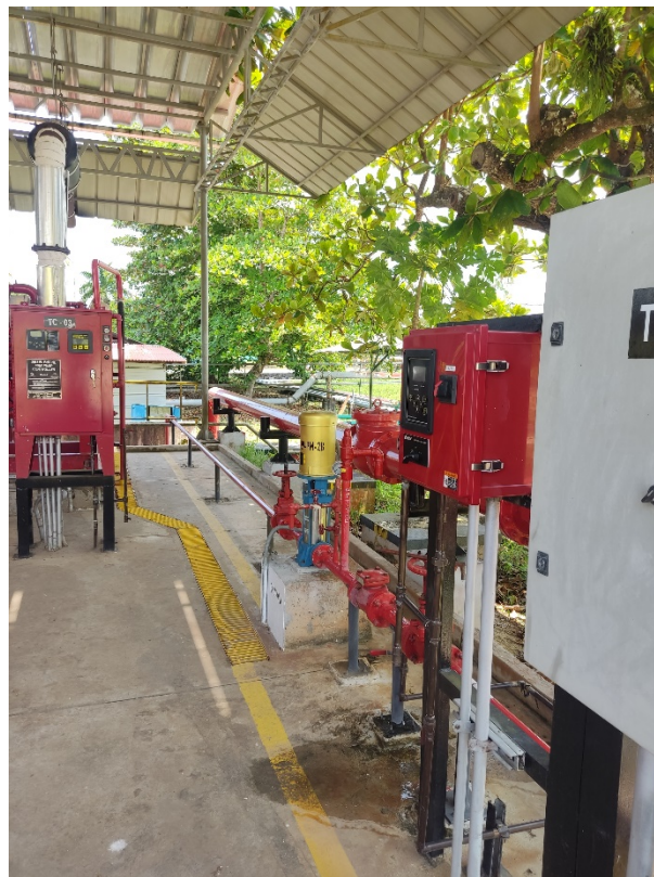
Bomba Jockey Sistema Contraincendios Refinería Iquitos.