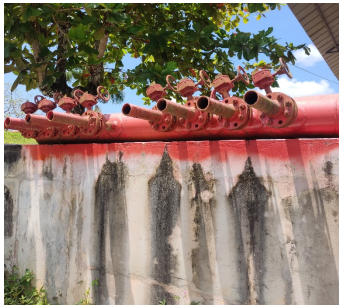
Cabezal de pruebas de la caseta de bombas contraincendios existente Refinería Iquitos.