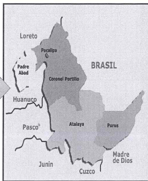
Mapa macro localización del departamento de Ucayali