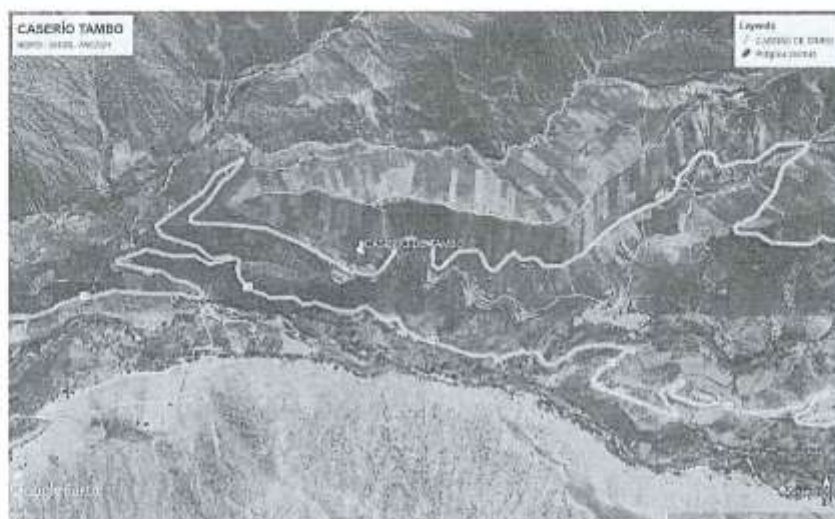
Imagen 1: SE OBSERVA LA LOCALIDAD DE TAMBO