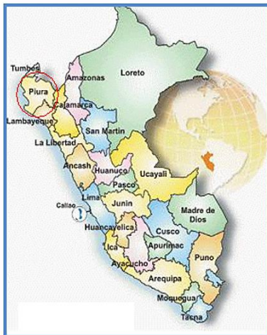
Gráfico N° 01: Mapa del Perú