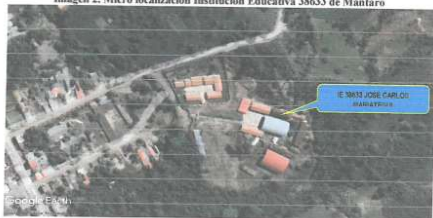
Imagen 2. Micro localización Institución Educativa 38633 de Mantaro