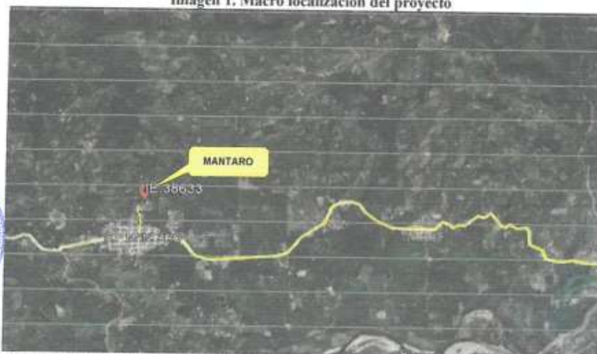
Imagen 1. Macro localización del proyecto