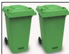
Imagen referencial zona estación catering