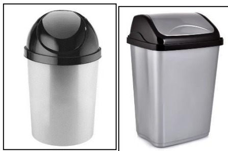
Imagen referencial tacho sala rueda, zona espera y zonas comunes