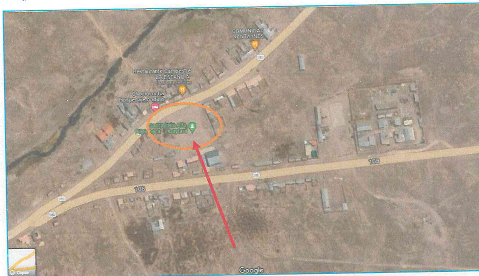
Imagen 1: Micro Localización del proyecto

"Año de la Unidad, la Paz y el Desarrollo"