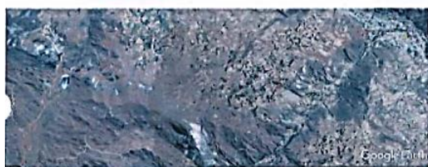
IMAGEN SATELITAL ZONA DEL PROYECTO Escala: 8:1