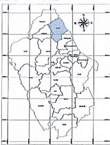
UBICACIÓN GEOGRÁFICA DE LA PROVINCIA DE HUAYO Escala 1:1,000,000