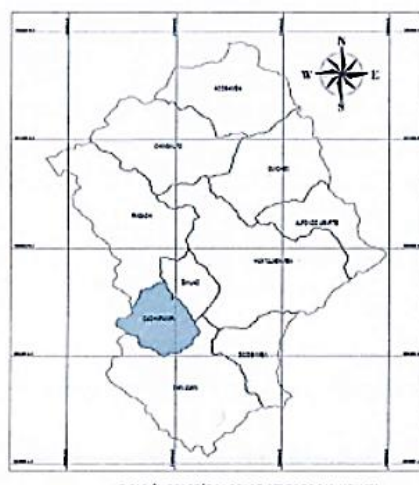
UBICACIÓN GEOGRÁFICA DE LA DISTRICTO DE CASHAPAMPA Escala 1:300,000