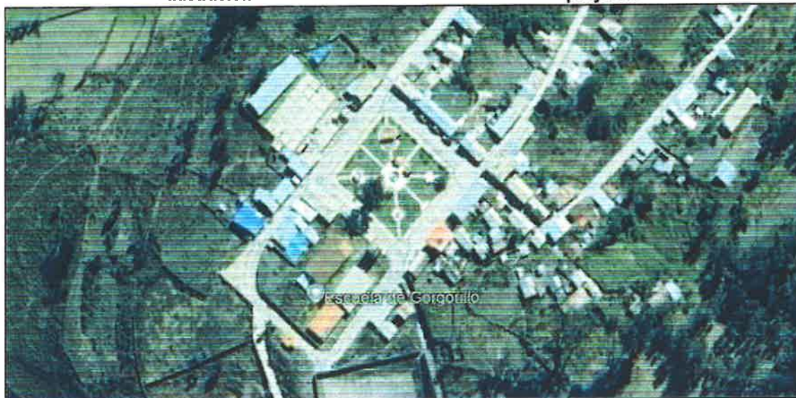
Ilustración 2.- Ubicación Satelital localización del proyecto