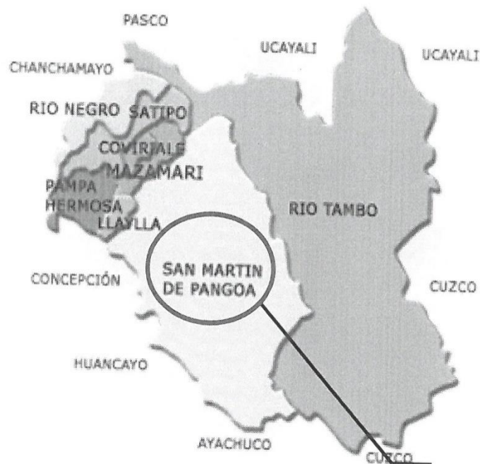
UBICACIÓN DEL PROYECTO