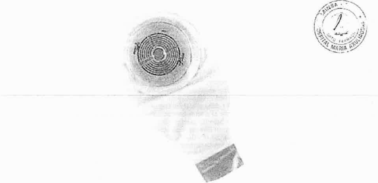
Figura referencial: Representación esquemática de una bolsa para colostomía de una pieza (no incluye diseño)