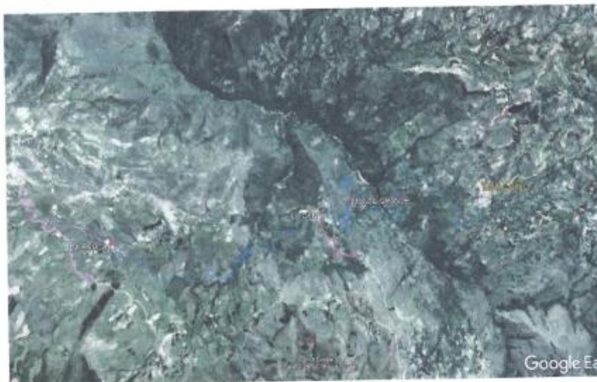
Imagen N° 3: Ubicación Local

La imagen muestra la ubicación del distrito de Saucepampa y Pulan, en la Provincia de Santa Cruz.