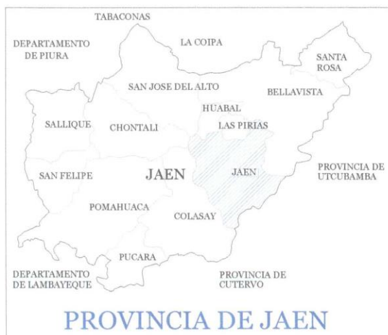
FIGURA N° 3: LOCALIZACIÓN DEL PI EN EL DISTRITO DE JAÉN