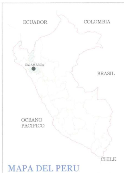
FIGURA N° 1: UBICACIÓN GEOGRÁFICA: PROVINCIA DE JAÉN