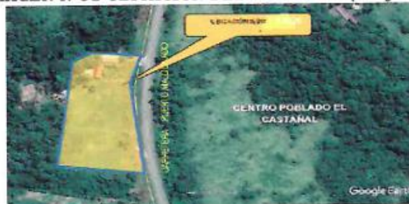
IMAGEN N°01 UBICACIÓN DEL PROYECTO (Grafico)

Nota: La atención de almacén de obra es: lunes a viernes 7:00 am hasta 5:30 pm y sábados de 7:00 am hasta 1:00 pm