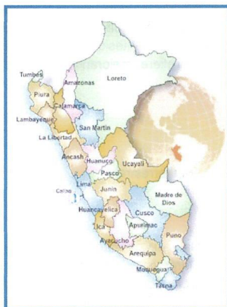
MAPA DEL PERÚ