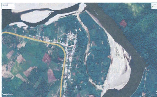
MAPA DE LA LOCALIDAD DE CAYENA