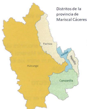
PROVINCIA DE MARISCAL