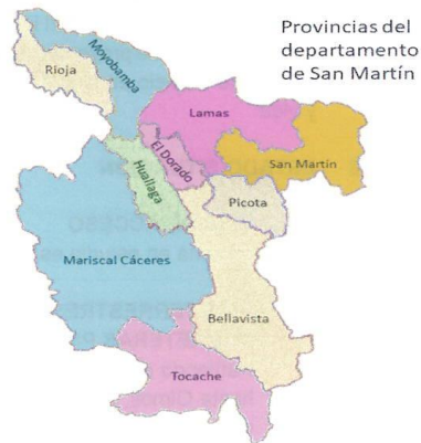
MAPA DEL DEPARTAMENTO DE SAN MARTIN