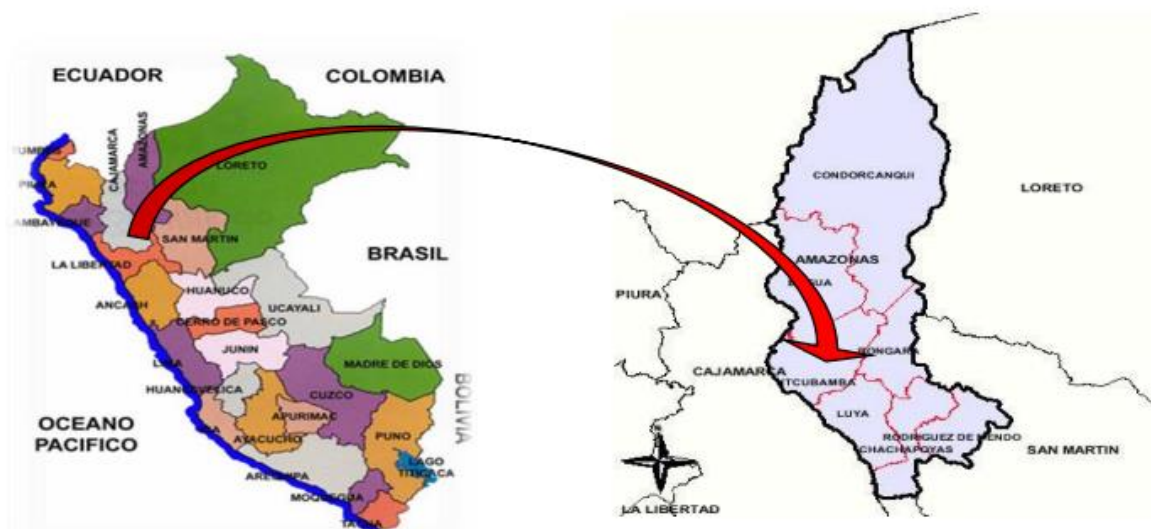
Gráfico N° 02: Localización Geográfica de la Provincia de Utcubamba y Distrito Bagua Grande