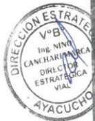
Imagen N.º - 02: Carretera Departamental AY-100