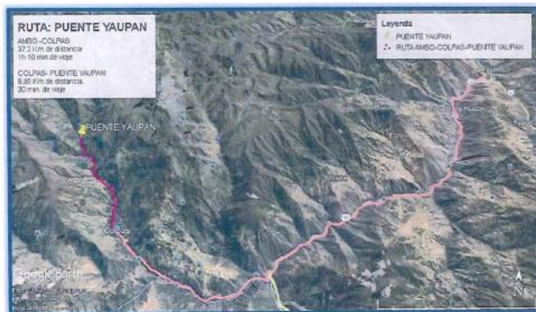
Imagen N° 01: Mapa de Acceso