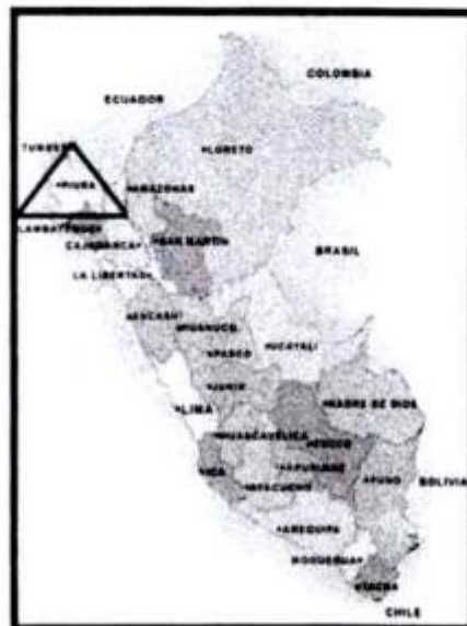
Figura 02: Mapa político del Perú.