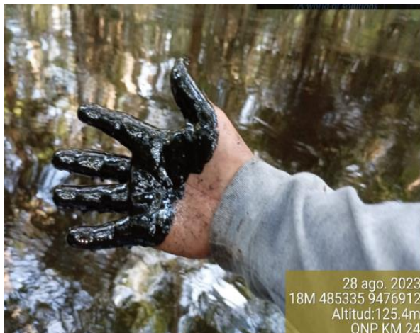
Identificación del punto de fuga en Km24+328