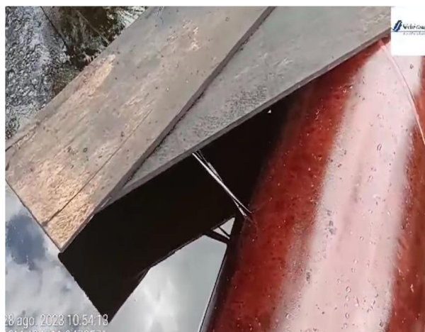
Habilitación de elemento sellante de madera