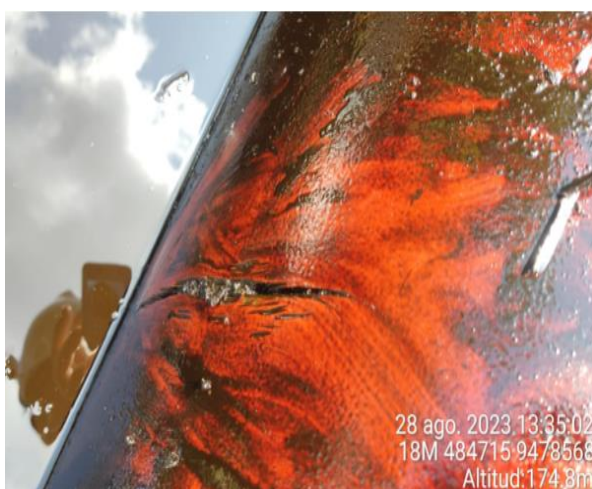
Instalación de elemento sellante de madera