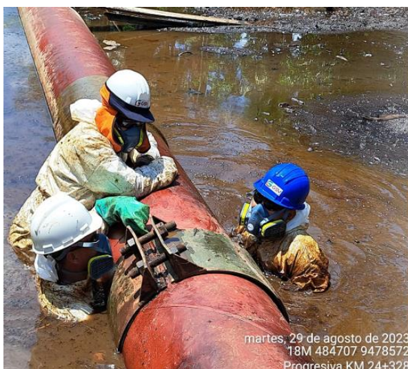
Ajuste de espárragos de grapa emperrada de 15 cm de longitud