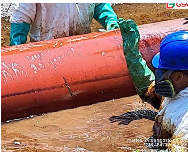
Fuga obturada con elemento sellante de madera