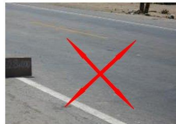
Lo que no se debe hacer en carretera pavimentada