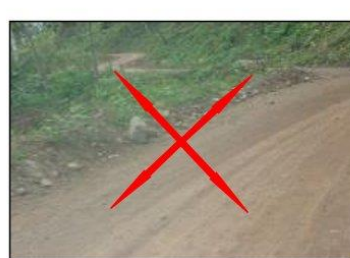
Lo que no se debe hacer en carretera no pavimentada

El CONTRATISTA CONSERVADOR entregará e instalará al CONTRATANTE dos licencias concurrentes perpetuas del software de visualización del Itinerario Fílmico, además de todos los archivos digitales del registro correspondiente.