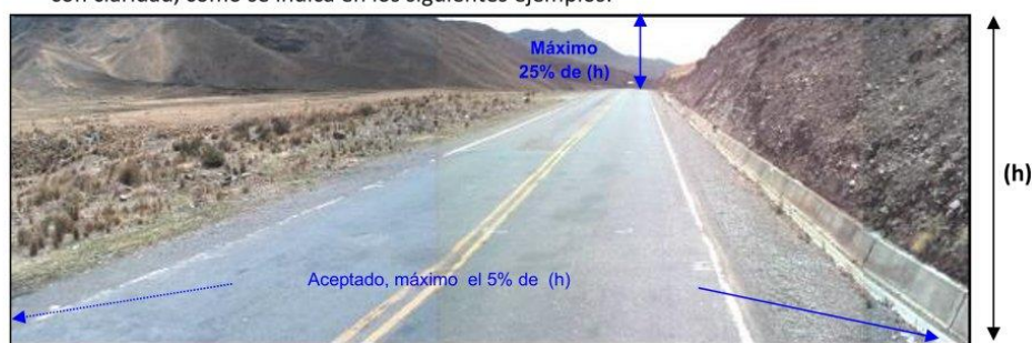
Parámetros aceptados de visualización para carreteras pavimentadas y no pavimentadas

También forman parte de las obligaciones del CONTRATISTA CONSERVADOR, la elaboración de un itinerario fílmico, consistente en archivos de secuencias de imágenes digitales a color cada 20 m, georreferenciadas, del recorrido de los tramos del corredor vial siguiendo su trayectoria ascendente y descendente (una secuencia de imágenes por cada sentido o con fotos de 360°), con una resolución no menor a 1280x960 píxeles, tomadas en días con buen brillo solar (sin lluvia o neblina), y con una amplitud de visualización de las imágenes (ángulo de apertura horizontal de la lente del equipo) de por los menos 120° (para la secuencia de imágenes por sentido), de forma tal que permita observar en su integridad el Derecho de Vía con claridad, como se indica en los siguientes ejemplos: