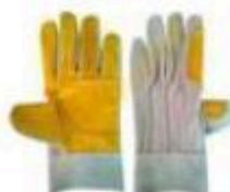
GUANTES DE CUERO

Para determinar que los postores cuentan con las capacidades necesarias para ejecutar el contrato, el órgano encargado de las contrataciones o el comité de selección, según corresponda, incorpora los requisitos de calificación previstos por el área usuaria en el requerimiento, no pudiendo incluirse requisitos adicionales, ni distintos a los siguientes: