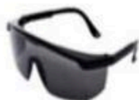
LENTES DE SEGURIDAD