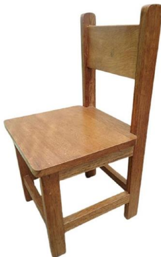
Imagen referencial N° 03.- Silla y mesa

"Año del Bicentenario, de la consolidación de nuestra independencia, y de la conmemoración de las batallas de Junín y Ayacucho"