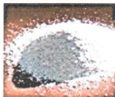
HIPOCLORITO DE CALCIO GRANULADO