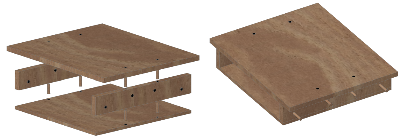
05 ENSAMBLAJE Escala: 1:10