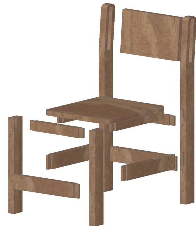
DETALLE DE UNIONES ESCALA 1 : 10