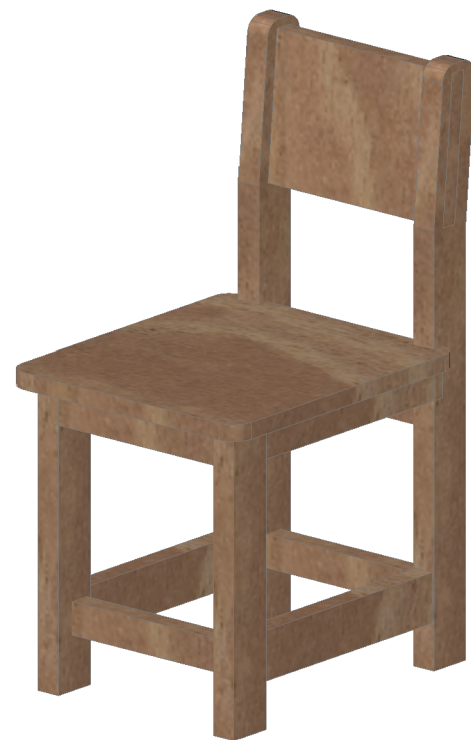
VISTA DE PERFIL ESCALA 1 : 10