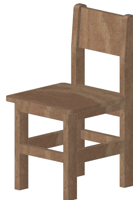
VISTA DE PERFIL