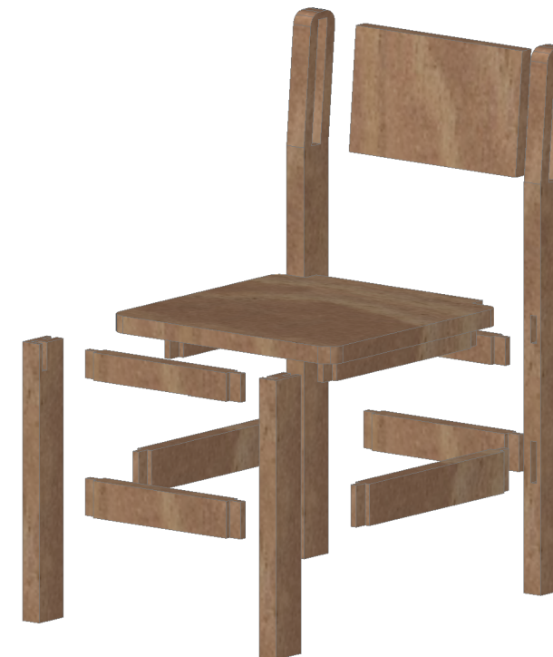
DETALLE DE UNIONES