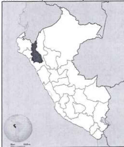
Ubicación del Departamento de Cajamarca en el Perú

El Proyecto se ubica en la ciudad de Cajamarca, la misma que se encuentra en la sierra norte del Perú, localizada en el margen este de la cadena occidental de la Cordillera de los Andes, en el valle interandino que forman los ríos Mashcón y Chonta, ambos conformantes del río Cajamarquino. La Ciudad se ubica en la zona superior oeste de la cuenca del río Cajamarquino y en la margen derecha del río Mashcón; la ciudad de Cajamarca es la capital del Distrito, Provincia y Departamento del mismo nombre.